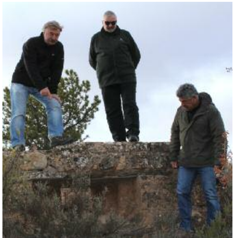
La Comarca Cuencas Mineras quiere poner en valor vestigios de la Guerra Civil

Hasta el momento, los vestigios más importantes se han encontrado en las localidades de Vivel del Río, Martín del Río, Huesa del Común, Rudilla, Segura de Baños, Utrillas (Las Parras de Martín) y en toda la zona de la Sierra de San Just que da a los pueblos de La Val, como Mezquita de Jarque, Cuevas de Almudén, Hinojosa y Aliaga, conservándose todavía en Vivel del Río o Rudilla, inscripciones en el hormigón de los parapetos sobre Azaña o la República, “viva el ejército español”, o incluso los nombres de las personas que allí combatieron, entre otras inscripciones, quedando todavía hoy en día, algunos lugares sin terminar de explorar como los restos del aeropuerto republicano de Muniesa o la zona de To-