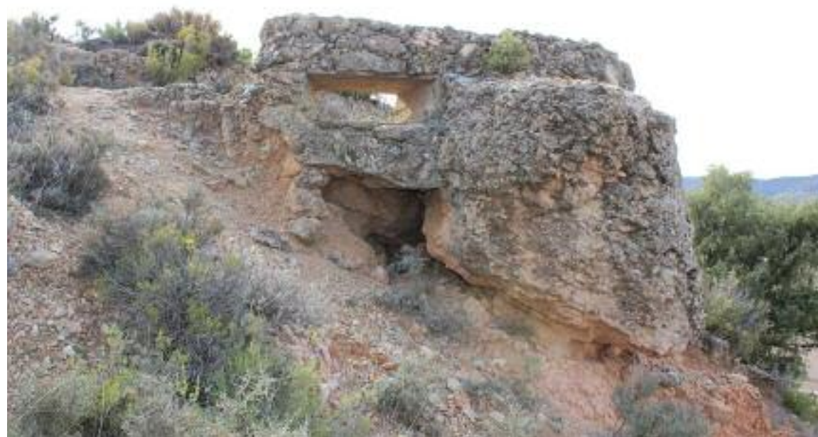
En el municipio de Martín del Río también se va actuar para recuperar los vestigios de la contienda civil.

para este mismo año es firmar un convenio de garantía juvenil con el Inaem, que ya se ha solicitado y se espera su aprobación, para la limpieza y restauración en vestigios ubicados en 4 localidades de la comarca.