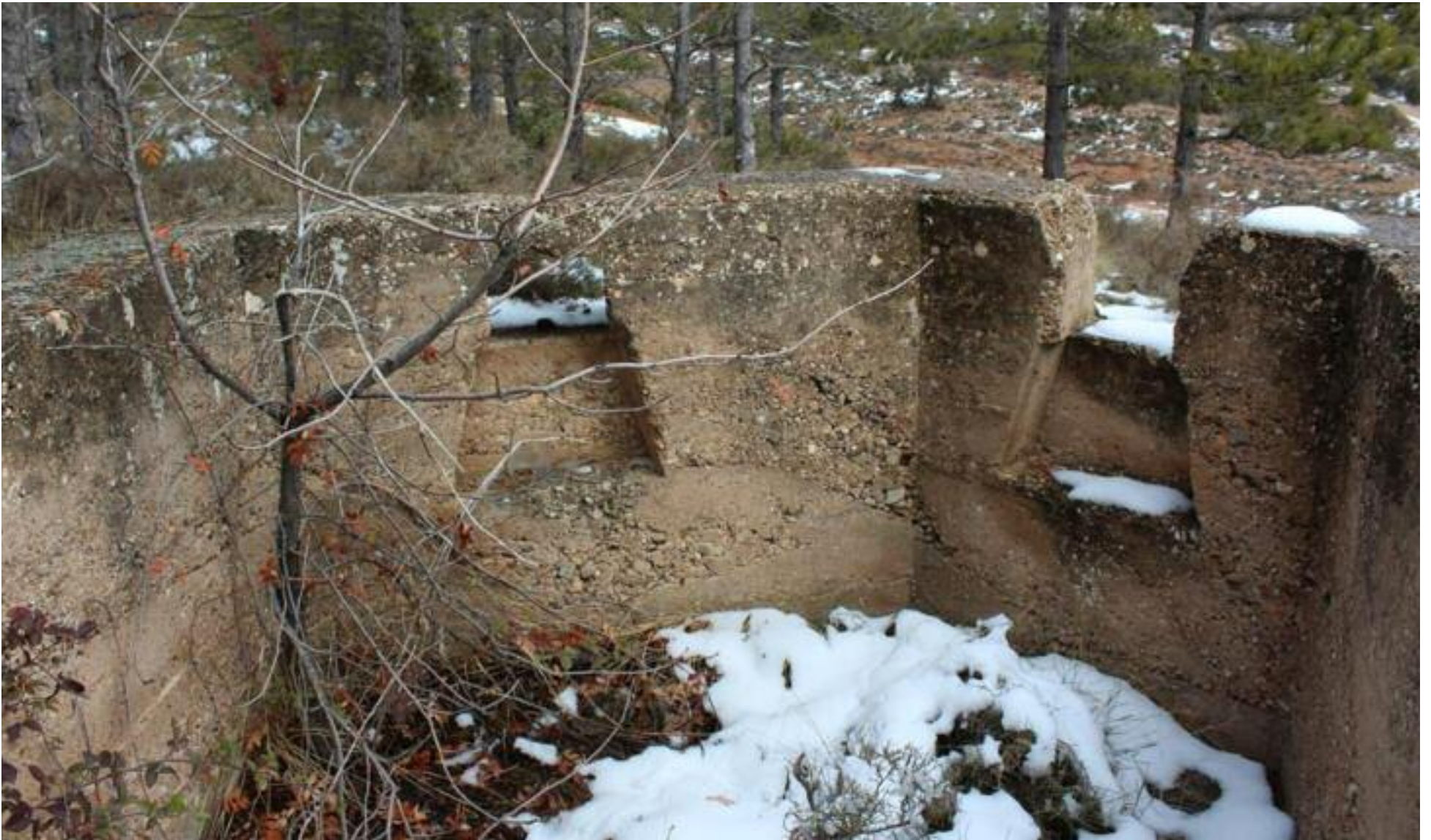
Vivel del Río es uno de los municipios que más vestigios de la Guerra Civil tienen en la Comarca Cuencas Mineras con nidos de ametralladoras, trincheras, que van a ser restauradas para el turismo